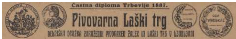
Odtisi priznanj na dopisnih listih pivovarne