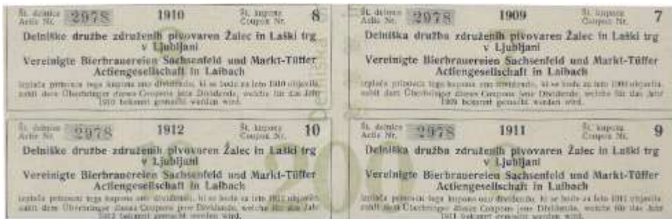
Kuponi delnic delniške družbe

Med prvo svetovno vojno je pivovarna zaradi pomanjkanja surovin obratovala z manjšo proizvodnjo. Vojna ji je zadala najhujši udarec. V razrvanih valutnih razmerah je dočakala svetovni