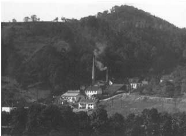
Laška pivovarna po 1. svetovni vojni