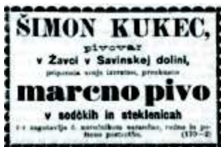
Oglas v SLOVENSKEM NARODU leta 1886