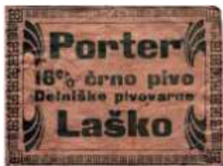
Letak za temno pivo

* Pivo porter, s katerim so laški pivovarji hoteli konkurirati unionskemu pivu bok, so Laščani zaradi pomislekov glede tujega imena začeli imenovati temno laško pivo. To je bilo močno pivo, danes bi v njem namerili nekaj manj kot 18% ekstrakta v osnovni sladici.