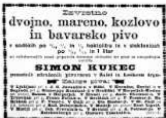
Letak v SLOVENSKEM NARODU leta 1890

SLOVENSKI NAROD je 15.1.1906 v daljšem članku Delniška pivovarna Žalec - Laški trg med drugim zapisal: Prejeli smo naslednje poročilo: Včeraj se je vršil v vrtnem salonu hotela »Ilirija« občni zbor delniške družbe pivovarne Žalec-Laški trg. Od 3000 delnic je bilo zastopanih 2367; udeležba je bila toliko, da je bila dvorana popolnoma polna. Upravni svet je poročal o III. upravnem letu, ki izkazuje v bilanci 263.000 K izgube. Ta izguba izhaja odtod, ker se je podjetju popolnoma neopravičeno predpisalo nad 28.000 K davka. Proti temu predpisu se je seveda upravni svet pritožil. Nadalje se je moralo od poslopij in od strojev odpisati na amortizaciji lani 63.000 K, letos pa 85.000 K. Poleg tega je nastala izkazana izguba vsled visokih pasivnih obresti. Upravni odbor je namreč, da povzdigne produkcijo piva, pivovarno v Laškem trgu popolnoma moderno preuredil, tako da je