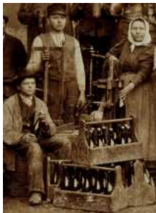
Detajl s slike na strani 9

Likvidacija pivovarne v Laškem je bila za kraj hud socialni in gospodarski udarec, saj je 100 ljudi ostalo brez zaslužka.