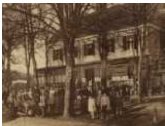
Kolodvorska restavracija Žalec leta 1925