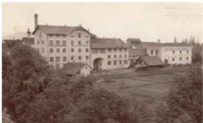
Pivovarna v Žalcu leta 1922