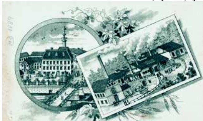
Pivovarna v Laškem na litografiji iz leta 1889