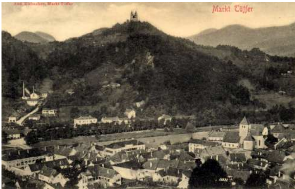
Laško okoli leta 1903 (levo zgoraj je pivovarna v Podšmihelu)

Poročilo »Narodovo« se nadalje sklicuje na izjave »strokovnjaka«, ki je bil poklican v Laški trg in v Žalec in baje izrekel, da je podjetje »nenavadno lepo urejeno,