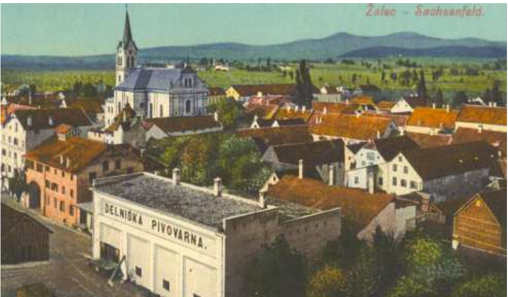
Žalec z Delniško pivovarno leta 1918

Leta 1920 so v Hudi jami zopet odprli premogovnik. Laška pivovarna je prebila skozi skalovje šmihelskega pobočja predor in skozenj zgradila ozkotirno progo za prevoz premoga od rudniškega nakladališča do kurilnice v tovarni. Predor je ohranjen še danes. Podjetje je za stanovanja svojih delavcev hkrati kupilo tudi veliko poslopje pod predorom (vila Karola). Delničarji pivovarne so sklenili izdati 9.000 novih delnic po 200 kron. Od tedaj je znašala delniška glavnicca 2.640.000 kron. Po dveh letih so glavnicco povišali na 8.000.000