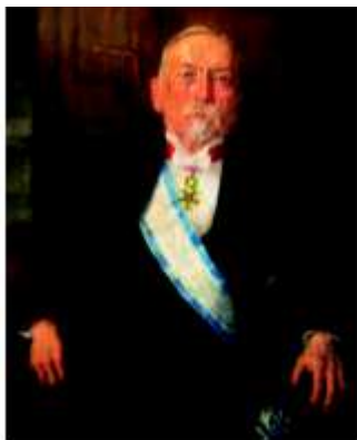
Ivan Hribar, ljubljanski župan, (Ivana Kobilca, 1920 - 1926)

V januarju 1906 je bila generalna skupščina vseh delničarjev Združenih pivovarn Žalec-Laški trg, d. d. v Ljubljani, na kateri je poročal glavni delničar in predsednik Ivan Hribar. O tej skupščini so pisali časniki obeh slovenskih političnih taborov: liberalni Slovenski narod je pisal za pivovarne ugodno, klerikalni Slovenec pa proti njim. Nasprotniki so vodili žolčne polemike po listih: Deutsche Wacht / Celje/, Grazer Tagblatt, Tagespost, Štajerc /Ptuj/, Laibacher Zeitung, Slovenec. Slovenske pivovarne pa so branili: Slovenski narod, Slovenski gospodar, Domovina, Narodni list, Soča in razna narodna društva.