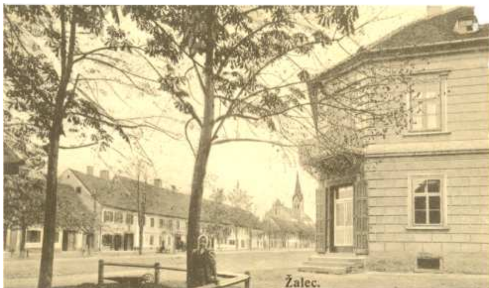
Središče Žalca s Kukčevo hišo v ospredju leta 1911